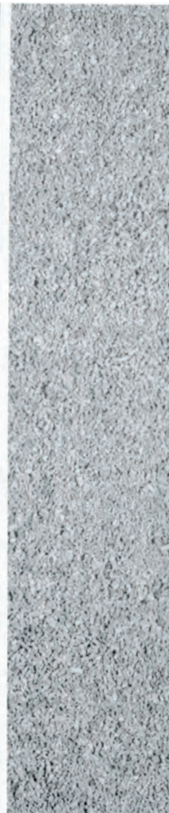
GRADE 2 - F