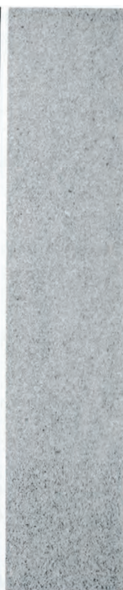
GRADE 1 - SF