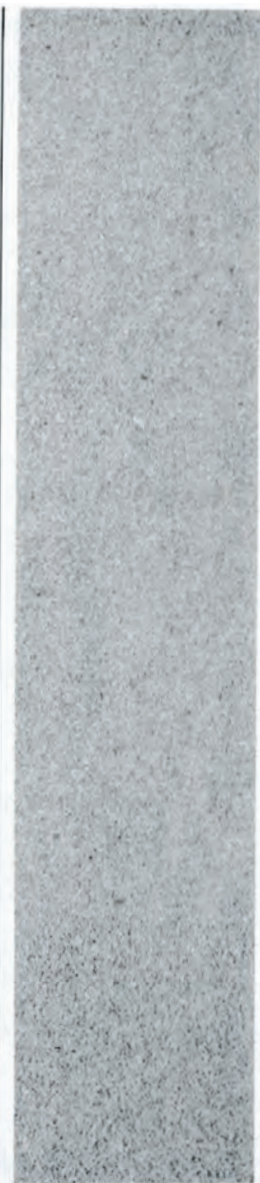
GRADE 1 - SF